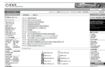
もっとホームページの活用を

問 以前定例会で、クレジットカードが利用できるような環境整備を提言していたが、経過を伺う。 町長 12月から、ヤフー公金支払にてクレジットカードやYahoo!ポイントでの納付が可能になった。