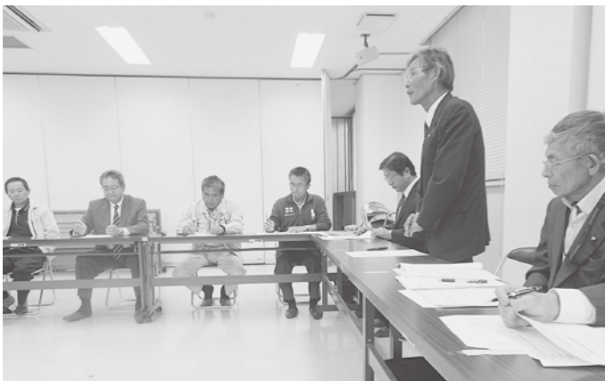
町建築協議会との懇談会

町長 ①飯山線全線にわたるSL運行と誘客は非常に有効と考える。ハイブリッド車両による新型リゾートトレインの定期運行を強くJR東日本に要望している。②秋山郷の案内看板の整備をはじめ、景勝地の整備を来年度進めてまいりたい。