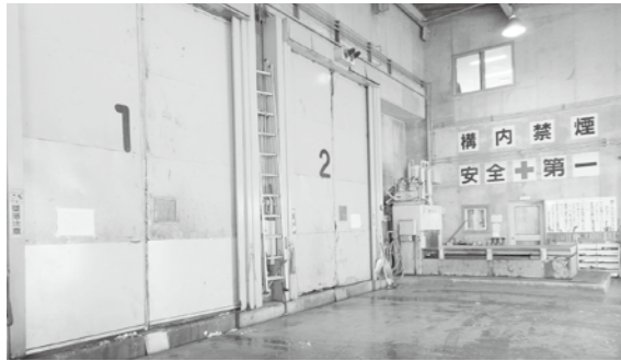
今後の動向が注目される

失効となる円滑化法の対応策は 問 来春3月に失効となる小企業円滑化法。事業再生に向けての取り組みが進まない中、可能性のある中小企業を切り捨てる事態が生じているのが現状と思われる。 早急に町商工会との連携をさらに満たし、充実した経営指導に向けての支援をするべきと思われるが。 町長 通常であれば金融機関の貸付条件の変更等が危惧されるが、地元金融機関については円滑化法失効による影響は無いと思われる。