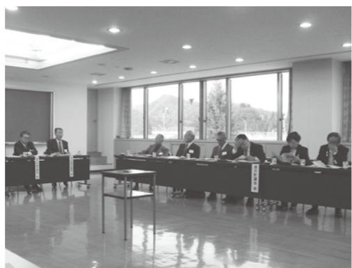
湯沢町議会との懇談会でも原発について話し合いました

直される契機となり、水力によって電気を起こしている当町の地位が相対的に重要視されることになる。国や事業者には、水力発電の地元を大事に思っていたいただきたい。以上の2点から、意見書の賛成討論とする。