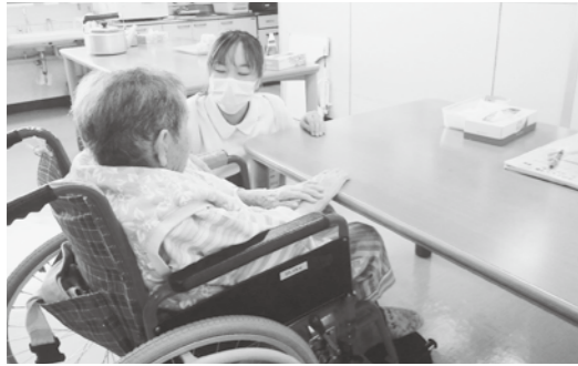
看護師不足のなかで頑張るスタッフ

問 津南病院をはじめ、福祉施設でも看護師不足は深刻である。建設予定の新十日町病院の基本整備計画には、「地元自治体が誘致する看護師等養成所の研修、実習に対応できる体制を確保」と明記されているが、県の責任で看護師養成所をつくるよう要望していただきたい。 町長 看護師が全県的に不足している実態に対し、具体策が行われていない中、看護師養成所の設置をはじめとする問題解決に向け、知事、県の病院局に強力に要望する。