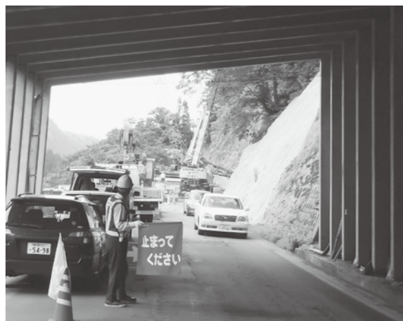
秋山郷へ向かう道中の工事風景