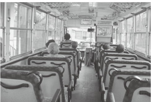
公共交通の活性化を目指して