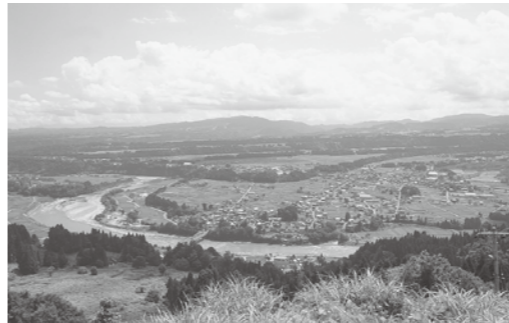
重要な観光資源、9段にも及ぶ日本一の河岸段丘

問 津南には夏祭り・雪祭りがあるが、観光との位置づけはあいまいであり少予算である。今後のあり方は。 町長 各イベントの考え方として夏は町民主体、冬は県外の誘客を図る中で、広く内外の皆様と一緒に楽しんでいただき、予算上げではなく、素晴らしい企画を提案いただきたい。 問 柏崎刈羽原発再稼働に対する町長の本意を伺う。 町長 脱原発の思いは国民意識の大きな流れであり、国勢の根幹に係ることである。安全が確保され、点検実証が明らかにされた場合は、国の原発政策のあり方として短期的には必要なのかと考えている。