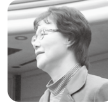
桑原 洋子 議員

しかしながら、早急に商工会関係者と協力体制をとり地域力アップを進めていく。 十日町新クリーンセンター連携後の町対応策は 問 十日町クリーンセンターが平成28年若しくは29年から集配業務がスタートされる予定であるが、津南町衛生施設組合との関係がまだ公表されていない。 建設後のゴミ処理料金、し尿、津南火葬場の方々の処遇や栄村と津南町との関係など今後の対応を伺う。 町長 十日町クリーンセンター建設は、平成25年に着工し、29年に完成予定であり、旧松之山、旧中里を組み入れた中で、1日135tのゴミ焼却施設とし、連続焼却施設として進める予定であり、し尿、火葬場についても現状維持を進めたいとのことである。 津南としては投資効果を含めた中で、住民サービスを低下させず十日町市・栄村と実務者レベルで話し合いを進める。 現行職員の処遇も責任をもって進める。