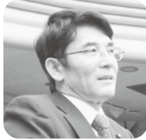
吉野 徹 議員