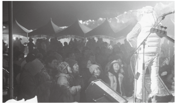
ニューグリーンピア津南での雪まつり