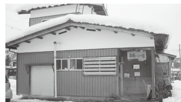
環境整備が望まれる「優しい家」

人工透析治療の送迎について 問 現在透析治療を受けている方の通院手段について、9月議会でも町長は「良く調査をしてみなければならぬ。いづれにしても町民の命は町が責任を持って守る」と答弁された。現在大変なご苦労をされておられる方を優先に平成25年度から実施できないか。 町長 具体的な提案をいただいたので、平等性を保ちながら全体的な見直しをつけて検討し、実効性のあるものにしていきたい。