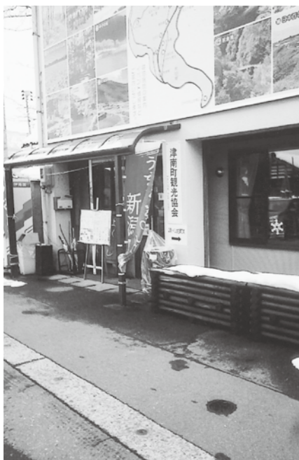
法人化も可能、町観光協会

問 農地の集約は進み、廃棄する農家は年々増加している。集約の存続も心配されている。これから地域を担う人を支援するために、未整備農地や再整備すべき所は町主導で整備すべきと思うが町の考えを伺う。 町長 農家の少子高齢化は全国的なもので、我が町も同様である。未整備農地再整備などは受益者の申請によるものである。米価の下落や転作面積の拡大などで基盤整備意欲が高まっているところであるが、再整備の可能性がある地域については、要望があれば積極的に支援したい。少子高齢化などへの対策は町の最大課題として取り組む。