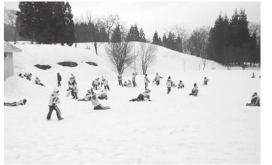
旧三箇小での雪体験（鎌倉小5年生）