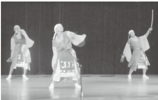
津南町無形文化財赤沢神楽