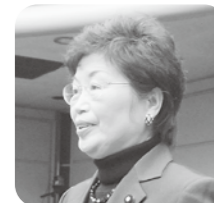
石田 タマエ 議員