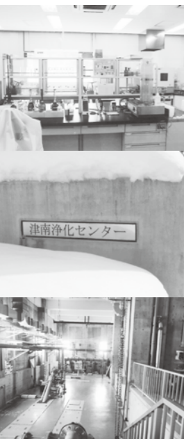
第1処理場・放水試験室

総合振興計画との整合性は 問 住民ニーズを確かなものにする予算は。 町長 子育て支援や町民の健康を守る施策に取り組んできた。新年度もこれらを優先的に取り組む。 問 町住宅改修補助金交付事業は、町内の経済効果を押し上げている。住民要望も多いことから新年度も継続されたい。 町長 4年間で、総事業費13億8,400万円となった。多大な事業成果をもたらしたと考える。経済対策必要性など判断して検討する。 問 公共下水と集落排水事業に毎年4億6,000万円が一般会計から支出され、両事業の起債残高(借金)が73億円ある。この返済期間及び中央地域の下水繋ぎこみが進んでいないが、今後を伺う。 町長 起債償還期間、公共下