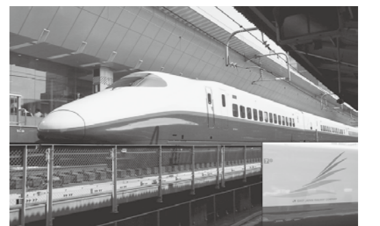
誘客が期待される北陸新幹線