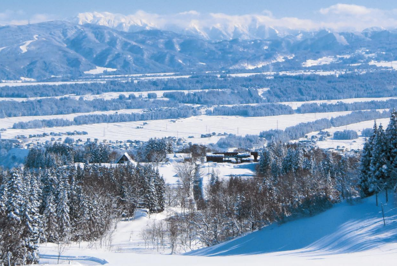
「元日の雪の河岸段丘」