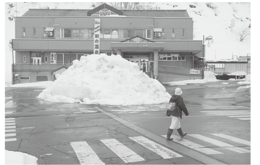
冬季の津南駅前、除排雪が望まれる

●冬期集落保安要員は、集落を限定せず人員配置されたい。 ●新潟県特定地域の自立・安全を支援する事業を活用して7集落に集落保安要員を設置していい。