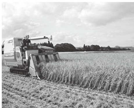
守ろう日本の農業と米

乗っ取るチャンスと言える。農村生活のあらゆるところが狙われていることを、私達は知る必要がある。TPPの本質をまだまだマスメディアもきちんと伝えていない。国のあり方そのものが変えられるTPP交渉参加を絶対許すわけにはいかない。