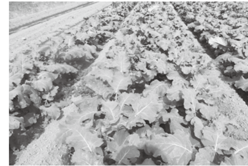
償還金が重くのしかかる開発農地

国が責任もって手当てするもの 問 国営苗場山麓開発事業は昭和43年から調査が始まり、昭和50年から第2地区での開発が始まった。しかし第2地区は広大な面積と事業量のため、農家負担も多額なものになった。事業半ばで国は補助率の高いパイロット事業を導入し、苗場地区とした。第2地区は負担が大きすぎるため、平準化事業などを取り入れ35年償還とし、負担軽減を図ってきた。第2地区と苗場地区の農家負担は、かんばい分を除いて水田10a当たり約34万円と約6万円という大きな差となり、畑でも約25万円と6万円になり、未だ償