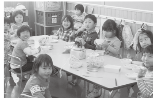
今後の対応が検討される保育園