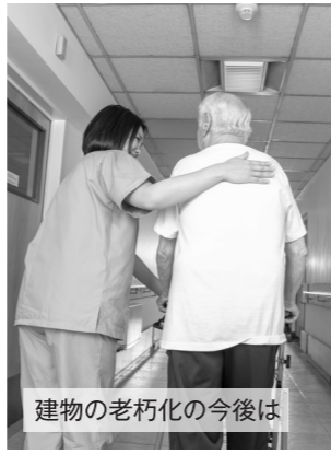
建物の老朽化の今後は

町長 病院機能を保ち足腰の強い病院経営を行うために、常勤医師及び看護師などの人材の確保育成が喫緊の課題である。また平均寿