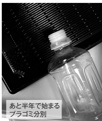
あと半年で始まる プラゴミ分別