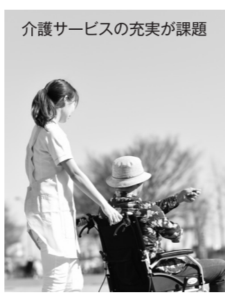
介護サービスの充実が課題

町長 財政の健全化、特に病院事業での赤字を改善した上で町民サービスの充実に応えたい。