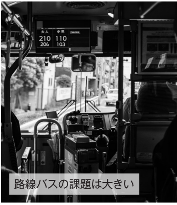
路線バスの課題は大きい

総務課長 路線バスの分を補っていくことが非常に重要だ。乗合タクシーを運行する中でその部分を確保したいと考えている。