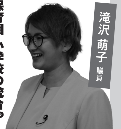
滝沢 萌子 議員