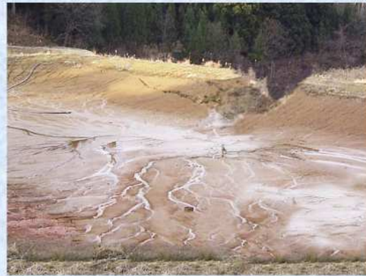
被災したため池(新潟県中越地震)

激しい豪雨により大・小含め、約240箇所の農業用ため池が堤防決壊などの被害を受けた。