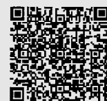
年度更新申告書 書き方パンフレット

労働保険のお手続きに「電子申請」をぜひご活用ください！(自宅やオフィスから24時間いつでも申告・納付が可能です)