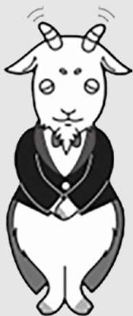
労働保険電子申請 イメージキャラクター ペパレス執事

電子申請・電子納付や口座振替のご利用、または 最寄りの労働局・労働基準監督署・金融機関で申告・納付を お願いします。