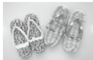
布ぞうり・ぞうり

お譲り頂いた布は、体験実習でワラ草履の鼻緒や布ぞうりに使われます。皆さまのご協力をお願いいたします。