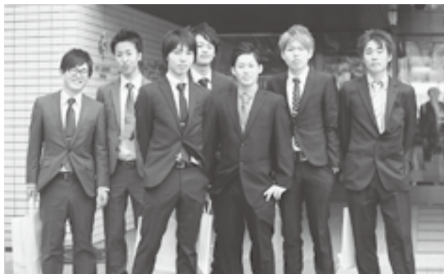
↑今日から大人の仲間入り。スーツがバッチリきまっています

卒業後進学した人 都会で働き始めた人 地元就職した人 それぞれの場所で 新たな道に進み がんばっている 仲間たちとの 久しぶりの再会は お互いがひとまわり 成長しているのを 確かめるように 楽しいひとときと なったようです