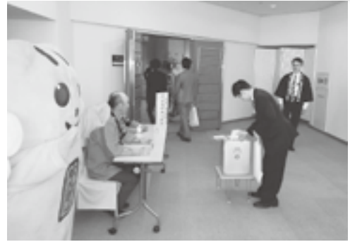
模擬投票所に立候補者（めいすいくん）も駆けつけました。ちなみに立候補者が投票日当日、選挙運動することは選挙違反となります。