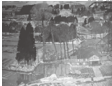
高橋皐氏が描いた「津南の風景(5月)」