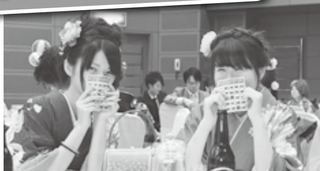
↑記念パーティではビンゴゲームなどをして楽しみました

何かを成すことはエネルギーのいることですが、これからも色々なことに挑戦していきましょう。