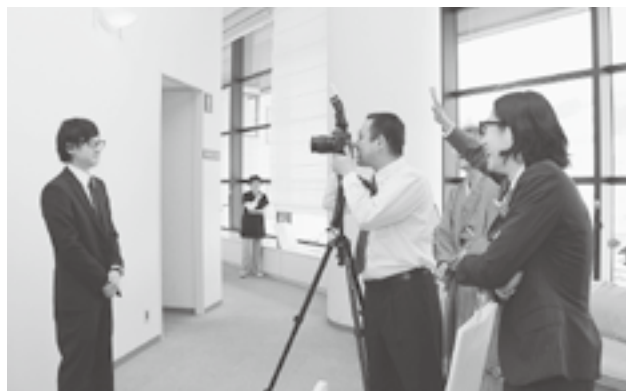
↑個人写真撮影では、緊張した顔をなんとか笑わせようと仲間が協力