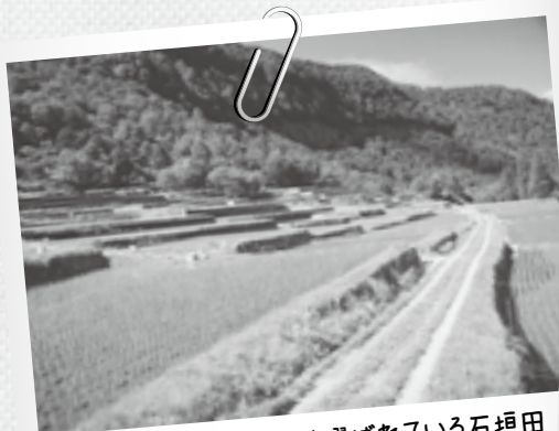
全国農村景観百選にも選ばれている石垣田