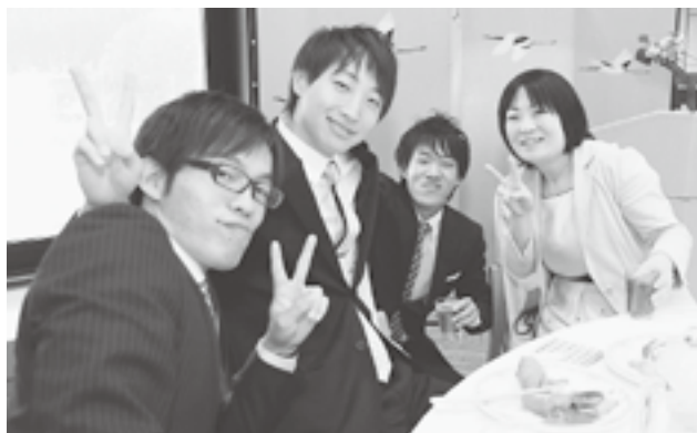
↑中学時代の恩師との再会

卒業後進学した人 都会で働き始めた人 地元就職した人 それぞれの場所で 新たな道に進み がんばっている 仲間たちとの 久しぶりの再会は お互いがひとまわり 成長しているのを 確かめるように 楽しいひとときと なったようです