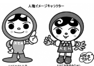
人権イメージキャラクター